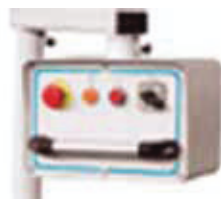
Pupitre de commande