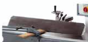
Inclinaison du guide