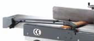
Pont de protection