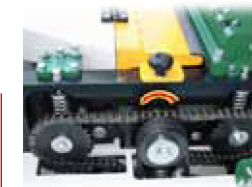
Entraînement par chaîne