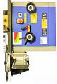
Papier de commande