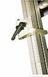
Règle télescopique et butée