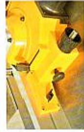
Réglage micrométrique des joutes