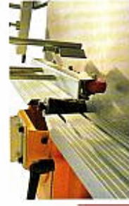
Arbre inclinable, presseurs