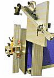
Chariot coulisant, guide d'angle, presseur