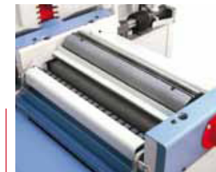
Arbre à 3 ou 4 Fers