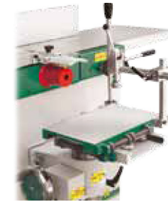
Mortaiseuse en option