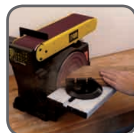
Table adaptable pour la bande et le disque